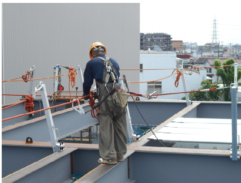
使用イメージ ※親綱は製品に含まれません